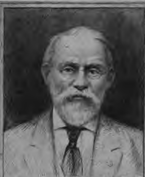
SILAS WRIGHT DUNNING BEQUEST UNIVERSITY OF MICHIGAN GENERAL LIBRARY